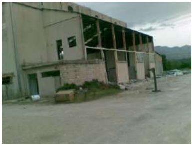
Requalification ancienne unité production vapeur